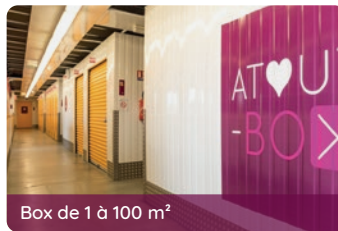
Box de 1 à 100 m 2