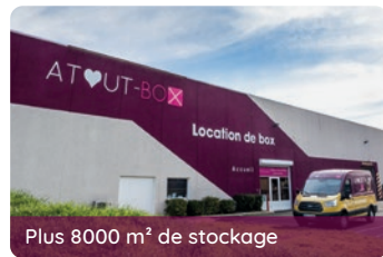
Plus 8000 m 2 de stockage

📍 Coordonnées GPS → Latitude : 43.6261572 Longitude : 3.9131406