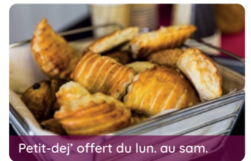
Petit-dej' offert du lun. au sam.