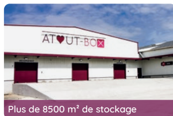
Plus de 8500 m 2 de stockage

📍 Coordonnées GPS → Latitude : 43.6261572 Longitude : 3.9131406