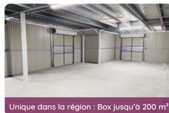
Unique dans la région : Box jusqu'à 200 m 2