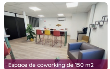
Espace de coworking de 150 m 2