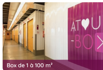
Box de 1 à 100 m 2