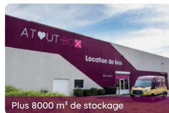
Plus 8000 m 2 de stockage