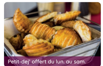
Petit-dej' offert du lun. au sam.