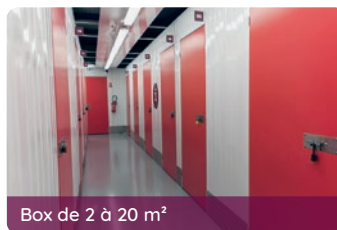
Box de 2 à 20 m 2