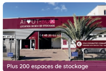
Plus 200 espaces de stockage