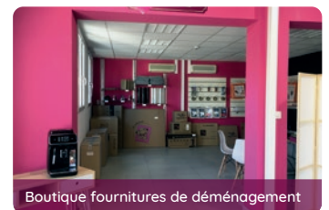
Boutique fournitures de déménagement